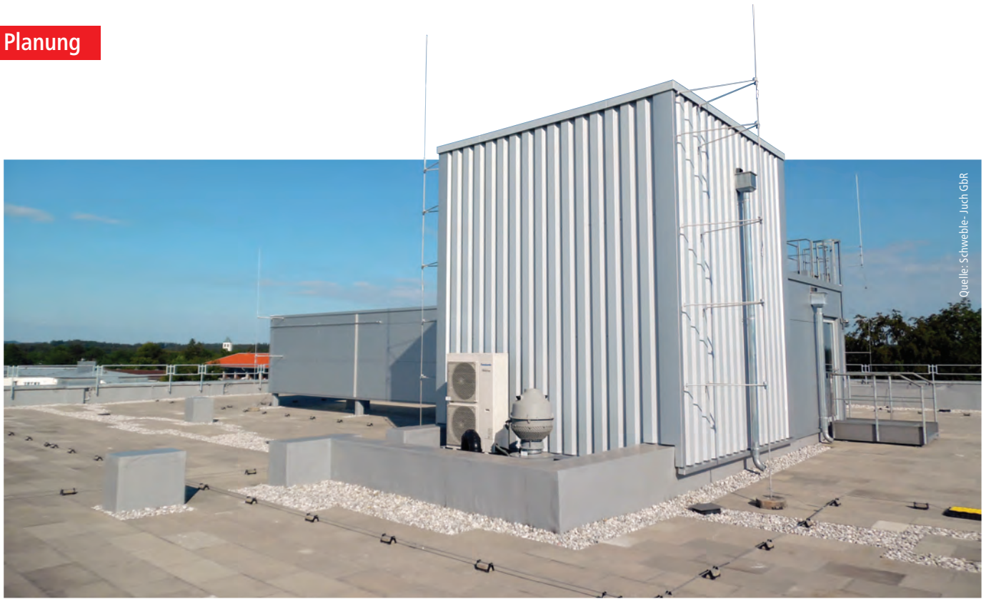
Abb. 3: Getrennte Fangeinrichtung, Industriebau, Sonderbau